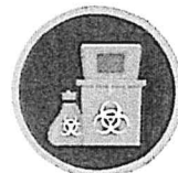
ถังขยะสีแดง