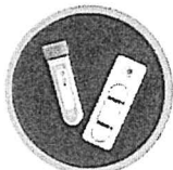
ชุดตรวจ Antigen Test Kit