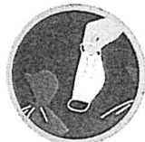
คัดแยกขยะ