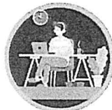
Home Isolation Community Isolation