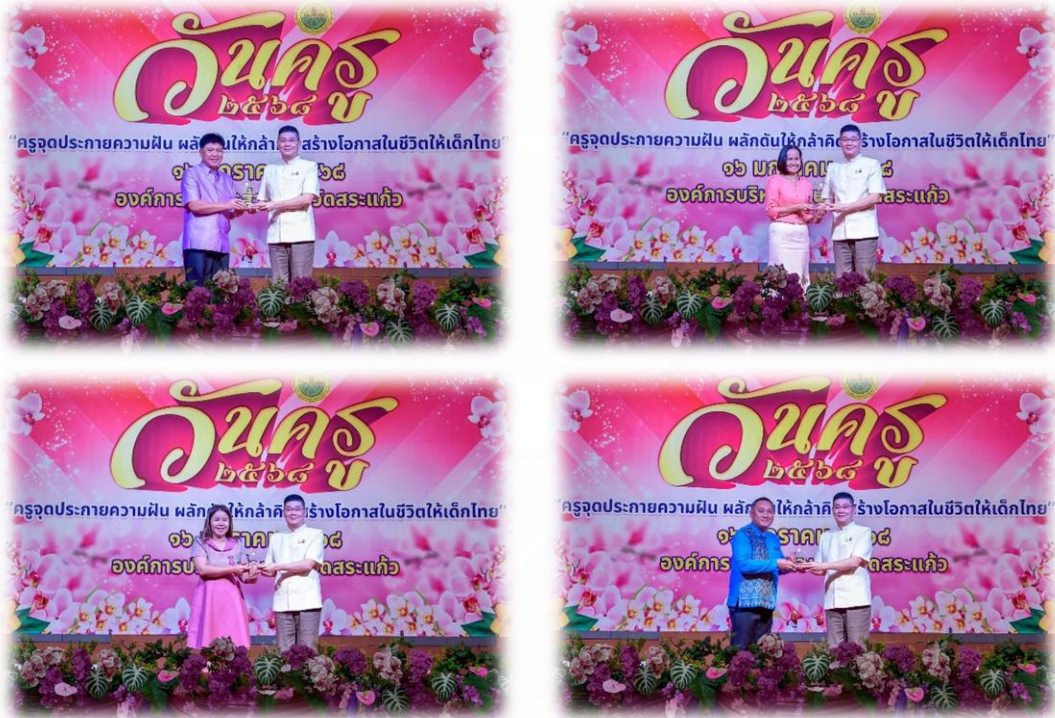
กิจกรรมเชิดชูครูดีเด่น ตามโครงการกิจกรรมวันครู ประจำปี 2568