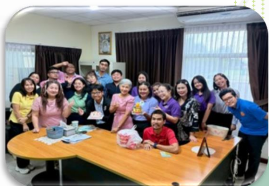
กิจกรรมอวยพรวันคล้ายวันเกิดให้กับบุคลากรในสังกัด