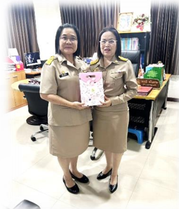
การแสดงความยินดีกับบุคลากรที่เข้ารับตำแหน่งใหม่