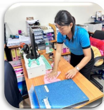
กิจกรรมปลูกต้นไม้ และกิจกรรม 5 ส