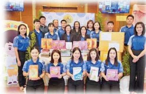
กิจกรรมปฏิทินเก่าเราขอ เพื่อส่งต่อผู้พิการทางการเห็น โดยรับบริจาคปฏิทินเก่า (แบบตั้งโต๊ะ) ส่งต่อไปยังศูนย์ผลิตสื่อเพื่อคนตาบอด นำไปผลิตอักษรเบรลล์สำหรับผู้พิการทางการเห็น