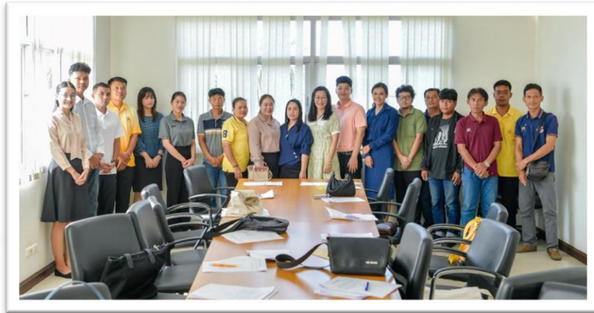
การประชาสัมพันธ์ให้บุคลากรที่มีรายงานตัวเพื่อแต่งตั้งเป็นพนักงานจ้างสมัครเป็นสมาชิกสภรณออมทรัพย์ข้าราชการองค์การบริหารส่วนจังหวัด