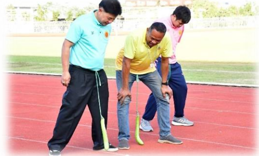
กิจกรรมกีฬาสามัคคีสัมพันธ์ องค์กรการบริหารส่วนจังหวัดสระแก้ว ประจำปีงบประมาณ พ.ศ. 2568