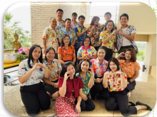
กิจกรรมรดน้ำขอพรเนื่องในวันปีใหม่ไทย