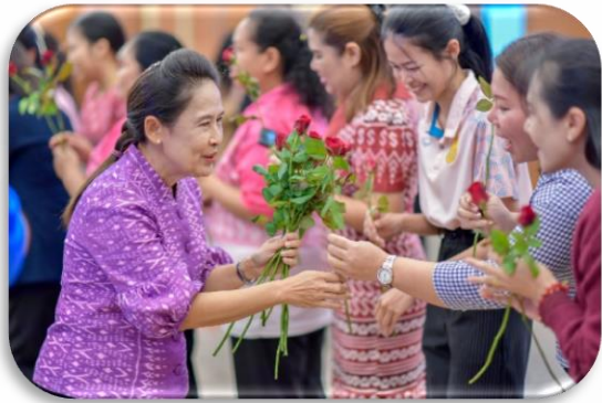
กิจกรรมงานมุทิตาจิตผู้เกษียณอายุราชการ