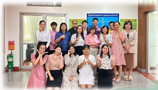
การแสดงความยินดีกับบุคลากรที่โอน/ย้าย