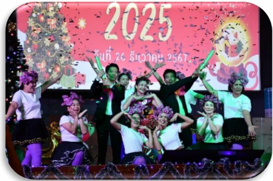
กิจกรรมงานเลี้ยงสังสรรค์ต้อนรับปีใหม่ ปี พ.ศ. 2568