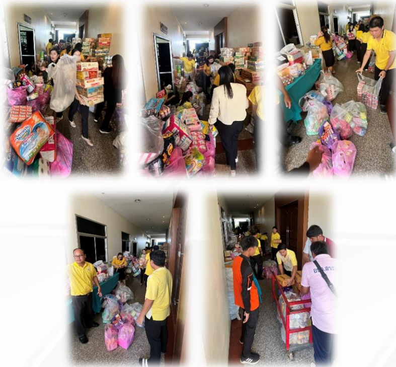
บุคลากรช่วยกันคัดแยกสิ่งของที่รับบริจาค เพื่อนำไปมอบให้กับผู้อพยพตามศูนย์พักพิงชั่วคราวในจังหวัดสระแก้ว กรณีเหตุสงครามระหว่างชายแดนไทย-กัมพูชา