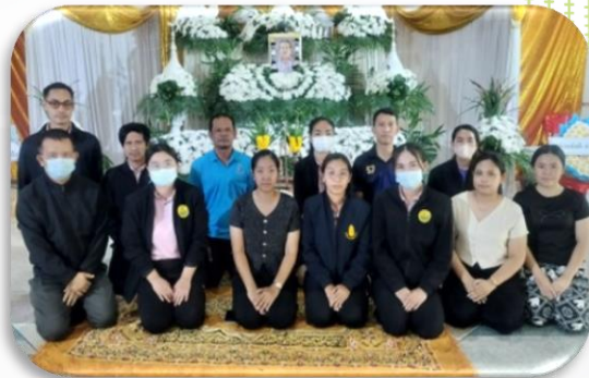
กิจกรรมให้กำลังใจบุคลากรในสังกัด กรณีบุคคลในครอบครัวเสียชีวิต