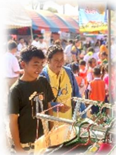
กิจกรรม อบจ.สระแก้ว ปันน้ำใจ มอบความสุขให้ประชาชน โดยรับบริจาคเสื้อผ้ามือ 2 (สภาพดี) ส่งต่อให้กับประชาชนผู้ยากไร้ในพื้นที่จังหวัดสระแก้ว