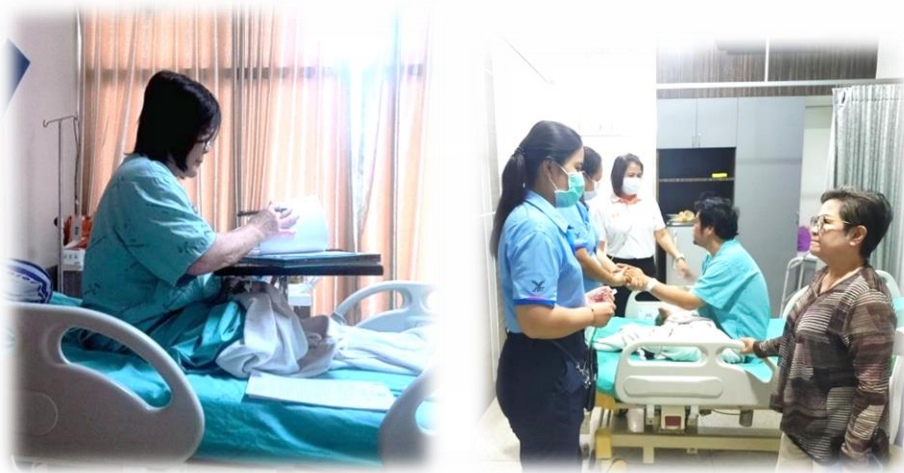
การเยี่ยมไข้และให้กำลังใจบุคลากรที่เจ็บป่วย