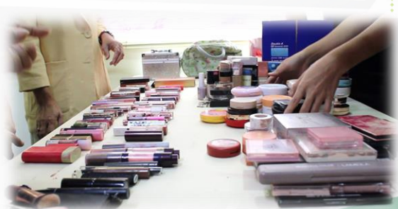
กิจกรรมแบ่งบุญสวย โดยรับบริจาคเครื่องสำอางที่ไม่ใช่แล้ว ทั้งที่หมดอายุและยังไม่หมดอายุ เพื่อส่งไปยังกลุ่มจิตอาสาไว้ใช้สำหรับแต่งหน้าศพหรือแต่งหน้านักเรียนในงานนาฏศิลป์