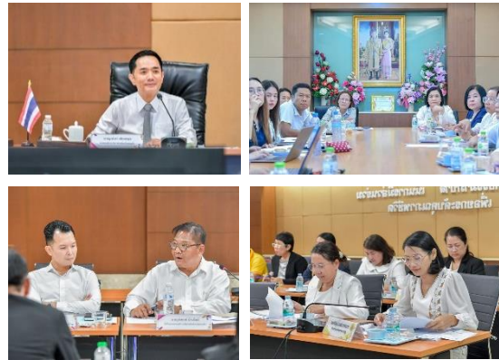
กิจกรรมรณรงค์ให้บุคลากรขององค์การบริหารส่วนจังหวัดสระแก้ว แต่งกายด้วยชุดขาวทุกวันพระ