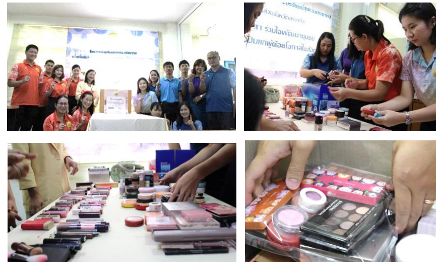
กิจกรรมแบ่งบุญสวย