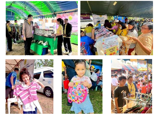
กิจกรรม อบจ.สระแก้ว ปั่นน้ำใจ มอบความสุขให้ประชาชน