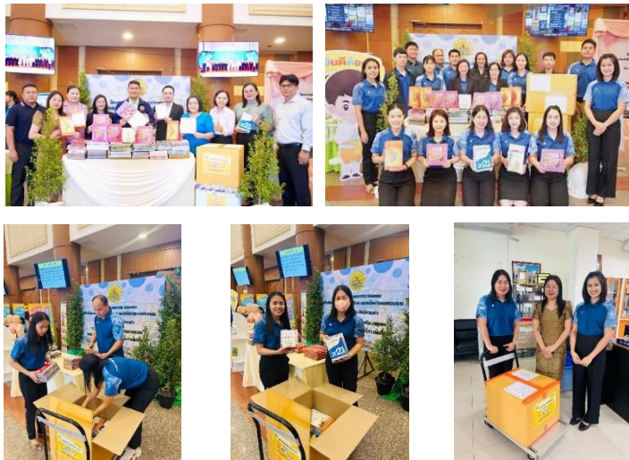
กิจกรรมปฐินเก่าเราขอ เพื่อส่งต่อผู้พิการทางการเห็น