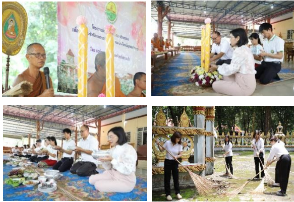
กิจกรรมทำบุญถวายเทียนพรรษา และถวายภัตตาหารเพลแด่พระภิกษุสงฆ์ เนื่องในวันอาสาฬหบูชา และวันเข้าพรรษา